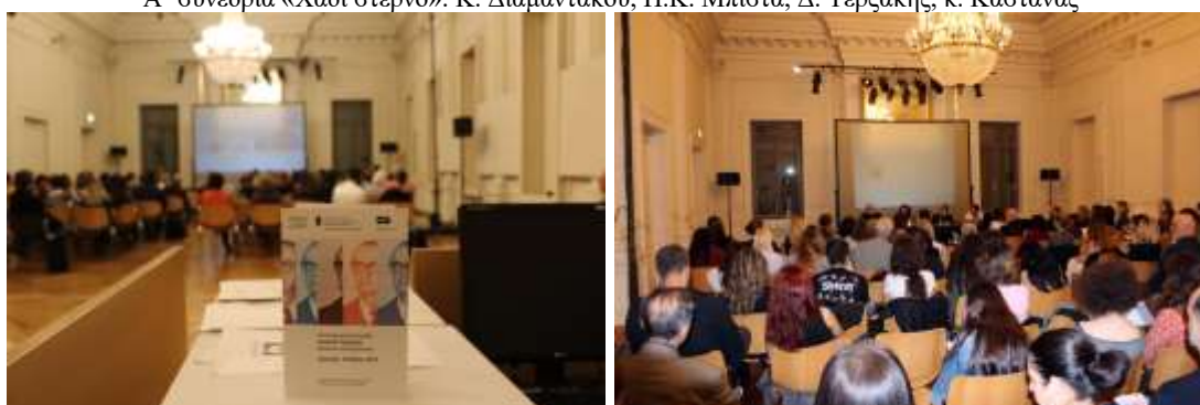
Στιγμιότυπα από την Ημερίδα για τον Άγγελο Τερζάκη