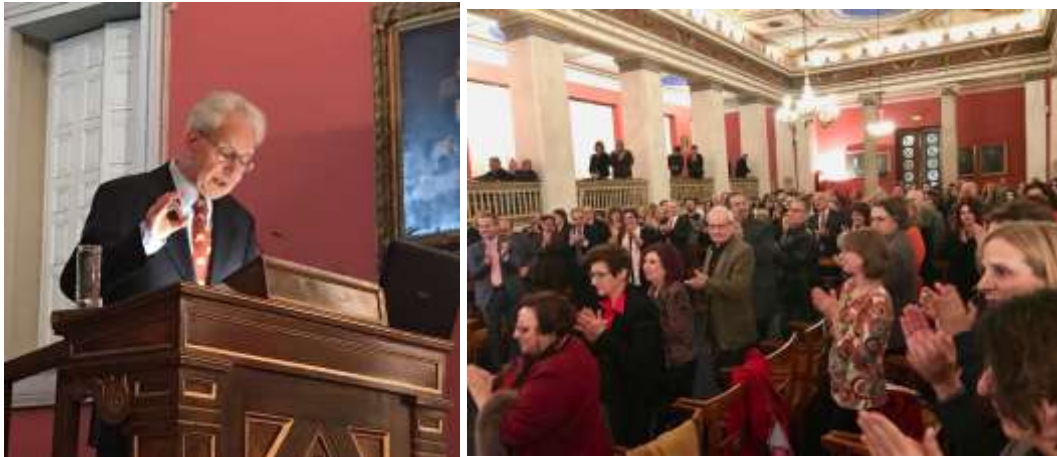
Στιγμιότυπα από την τελετή