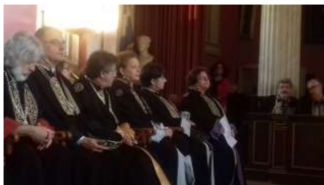
Στιγμιότυπα από την εκδήλωση του επετειακού εορτασμού